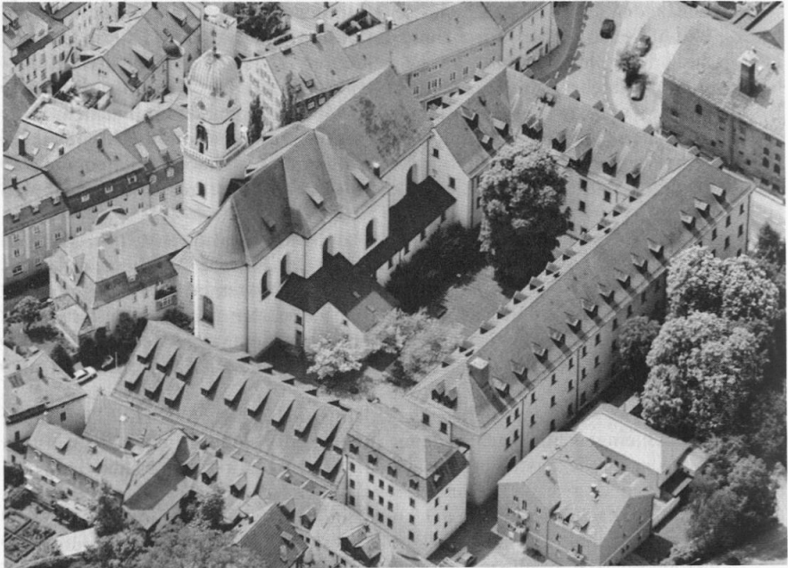
Abb. 3: Luftaufnahme des Hochschulensembles in Regensburg-Stadtamhof, ca. 2008