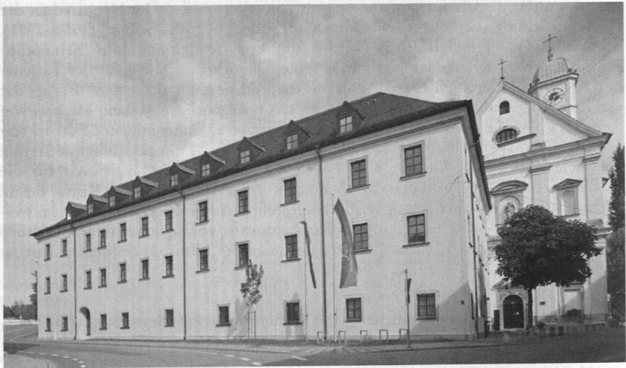
Abb. 4: Seitenansicht des Hochschulgebäudes, Andreasstraße 9, Regensburg-Stadtamhof 2009