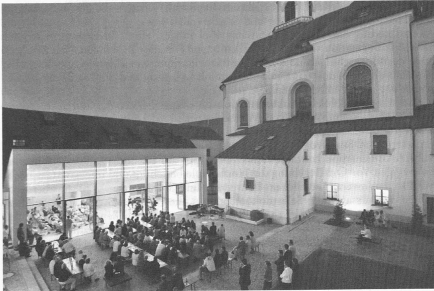
Abb. 6: Innenhof und Foyer der HfKM Regensburg, Sommersemesterabschluss 2009